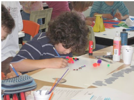
Un élève de l'école Rose-des-Vents lors d'un atelier sur la scénographie autour du spectacle Cabaret au bazar en mai 2008.