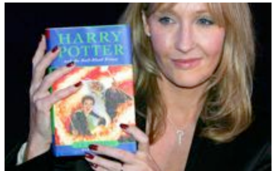
J. K. Rowling, l'auteure des romans Harry Potter .

... J. K. Rowling, la célèbre auteure des romans Harry Potter , a imaginé et écrit le premier tome de la série dans des cafés, un peu comme les auteurs des siècles passés qui écrivaient à la lumière des bougies des tavernes et des cabarets? En effet, Madame Rowling vivait alors très humblement; il faisait trop froid dans son logement pour qu'elle y travaille. On imagine facilement que les choses ont changé, depuis le succès mondial qu'ont connu ses romans !