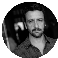
CHRISTOPHE GARCIA CHORÉGRAPHE ET METTEUR EN SCÈNE

c'est la personne qui crée les vêtements des acteurs pour les aider à devenir leurs personnages.