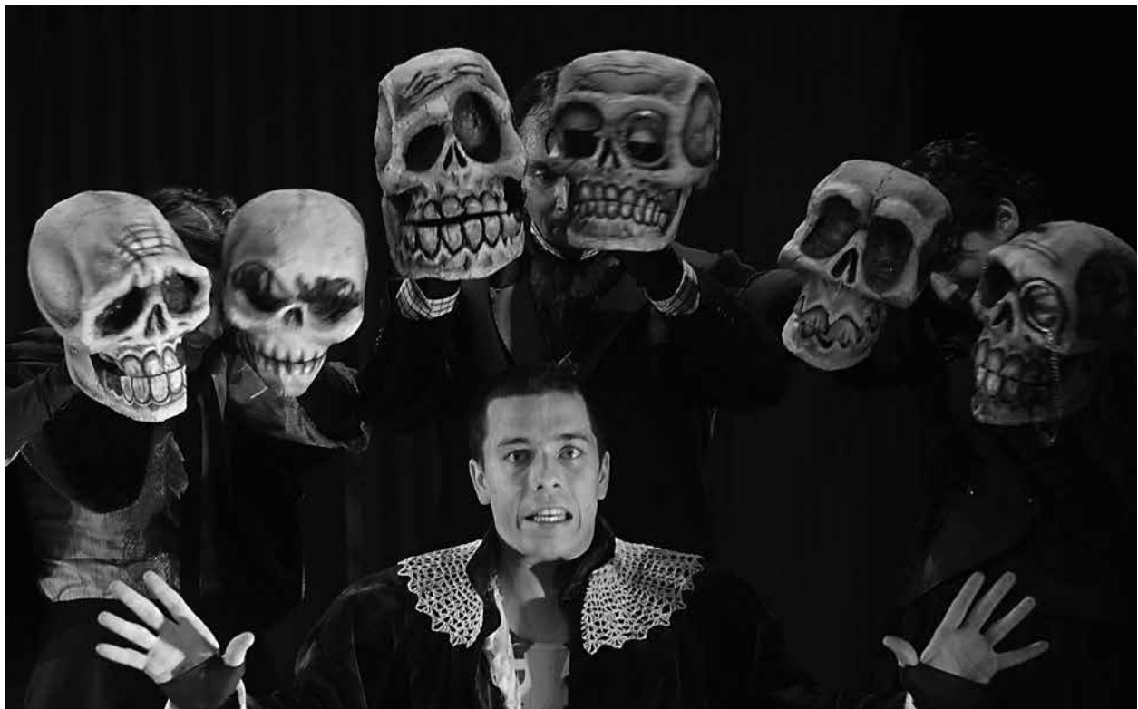
Le fantôme de Canterville (2006). Photo: Louise Leblanc.