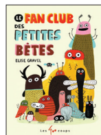
Le fan club des petites bêtes Elise Gravel Texte et ill. Élise Gravel Éditions Les 400 coups 2021, 56 p.

Qu'y a-t-il de plus plaisant que de reconnaître sa chanson préférée lors d'un concert ? Un lien d'écoute sera disponible sur la page du spectacle sur le site de la Maison Théâtre.