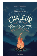
Comme une chaleur de feu de camp Amélie Panneton Hurtubise 2017, 300 p.